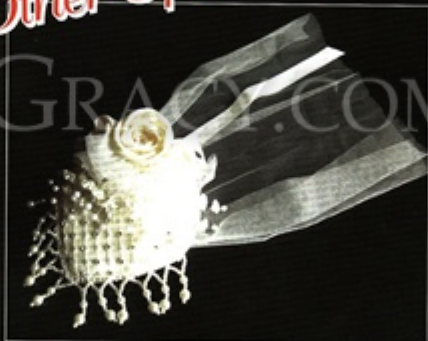
Medium-sized Wedding Hat provided by ME & Co