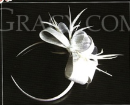
Silver Hairband provided by ME & Co