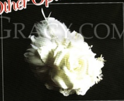
Small-sized Wedding Hat provided by Peony Bridal 一朵大大的白色花，簡約而別致，店員說此頭飾極受客人歡迎。