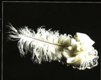
Medium-sized Wedding Hat provided by Wgallery