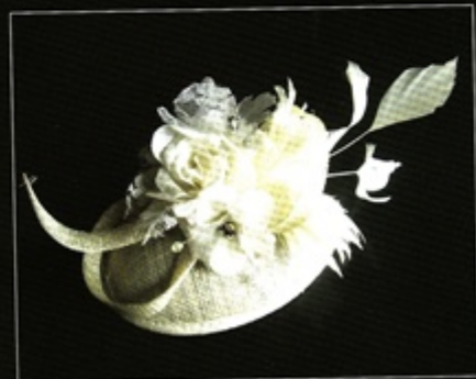
Small-sized Wedding Hat provided by Wgallery 這個頭飾設計極為精緻，帽底是米色草帽，並以相同質料在帽頂釘了一條繫挺的Ribbon，非常漂亮。